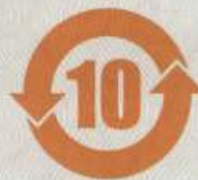
图2 标志 II